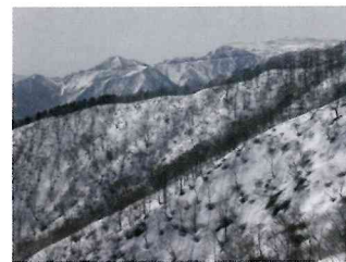
岐阜県揖斐川町「虎子山からの眺め」

日本100名山、200名山、300名山と指定された山があり、合計300名山です。もともとは日本100名山の登頂を目指していましたが、近くにある200名山や300名山も同時に登るようにしました。日本100名山は登山者が多く、登山道が整備され、案内板もきちんと整備されていますが、日本200名山や日本300名山になると、登山道の整備や案内板が不十分な山があります。登山は登った時の達成感を味わうことが出来ますが、事故も背中合わせです。登山計画、装備、天候等十分検討して実行することが大切です。