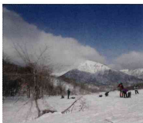
岐阜県郡上市「野伏ガ岳」

私は妻の山仲間と一緒に15年以上に渡り、全国の山に登りました。最北端の利尻岳から最南端の宮之浦岳まで日本300名山のほとんどを登ることが出来ました。山に登るだけでなく、山の周辺の街並みや景色を楽しみ、名所旧跡を巡り、温泉で疲れを癒しました。山旅は3日位から2週間ほどの日数をかけて旅と登山を楽しんできました。全国の山に登りながら楽しんできた山旅で印象に残るものを北海道から九州までご案内したいと思います。北海道は冬は雪の為、登山が出来ませんので、夏に限定されます。北海道まではフェリーを利用しています。グループの場合の宿泊は民宿を利用し、二人での旅の場合は車中泊です。東北、関東、九州の場合も民宿を利用し、二人の場合は車中泊です。中部、近畿、中国、四国は二人での山旅はほとんどで車中泊です。