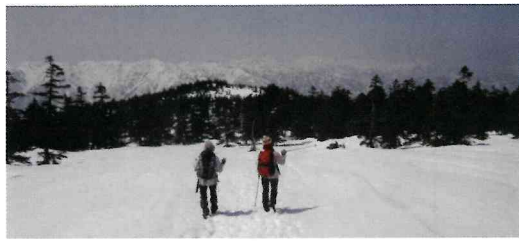
岐阜県大野郡白川村「猿ヶ馬場山」